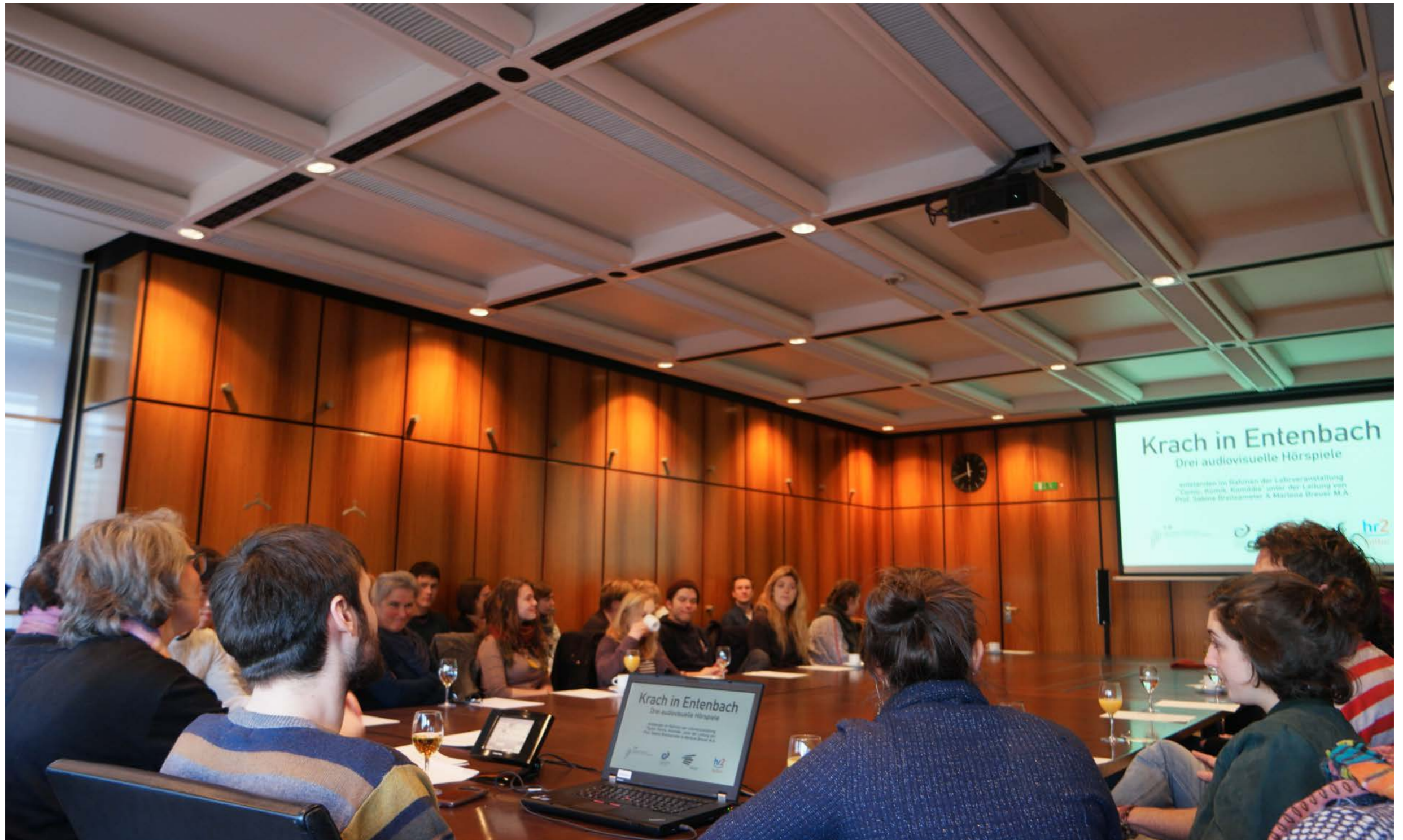
Vorstellung der Produktionen vor Redakteuren und Redakteurinnen sowie weiteren Gästen im Kleinen Konferenzsaal des Hessischen Rundfunks (20. Januar 2017)