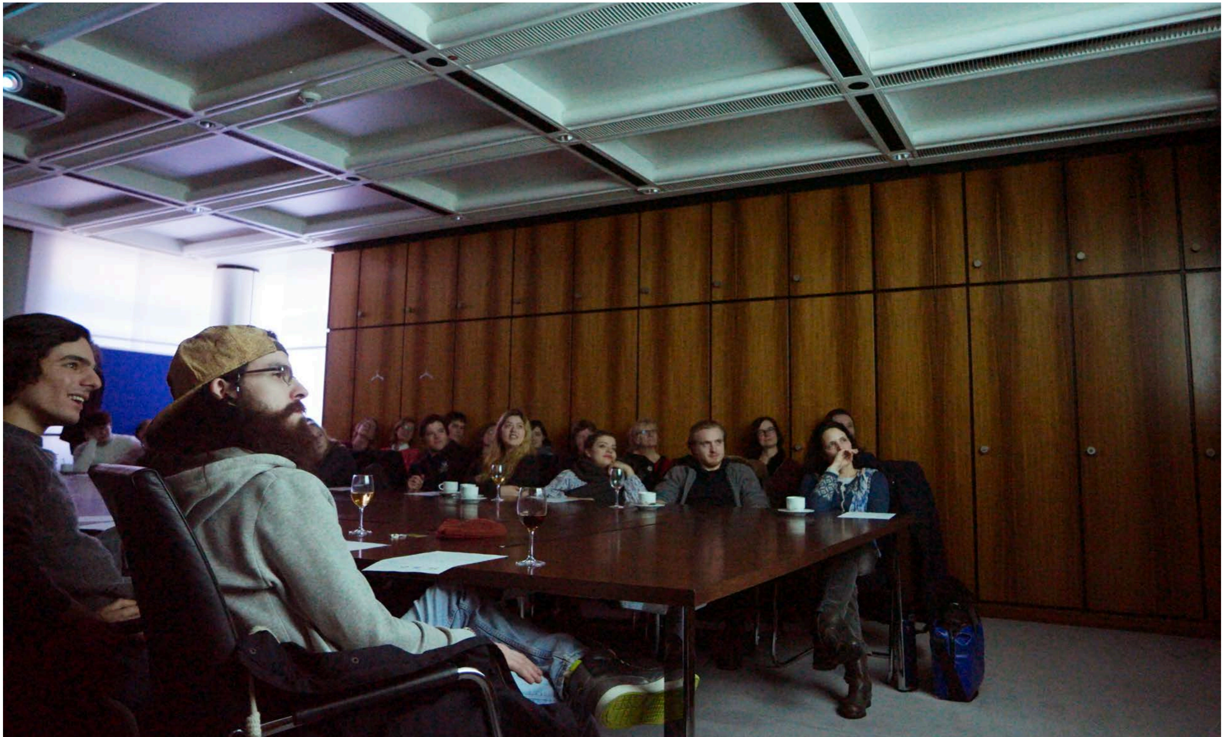
Studierende und Publikum hören und schauen sich die Produktionen an (20. Januar 2017)