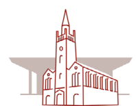
Stiftung St. Matthäus